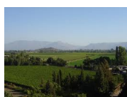
Foto Panorámica del Valle