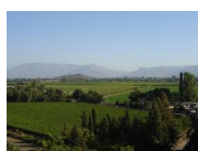
Foto Panorámica del Valle